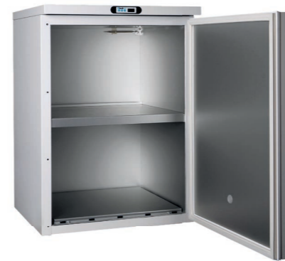
K131 WE Wärmeschrank