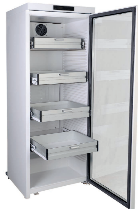
K380 MUEG-KL Medikamentenklimaschrank