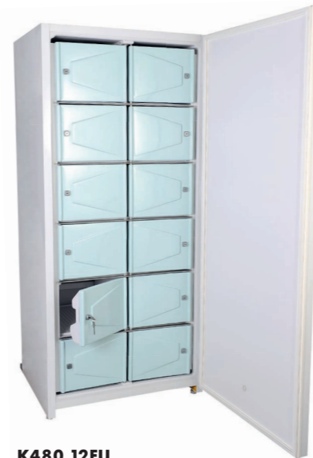
K480 12FU Gemeinschaftskühlschrank