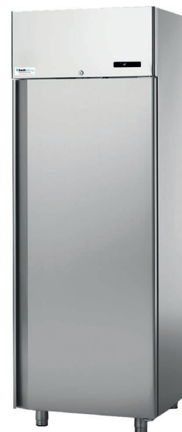
G700 MUE Réfrigérateur à médicaments