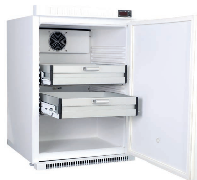
K125 MUE-E Réfrigérateur à médicaments