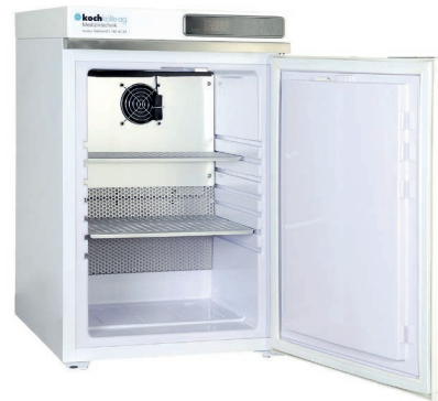
K40 MUE-W Réfrigérateur à médicaments