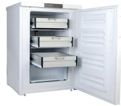
K-30°C ME 104L-A Congélateur à médicaments