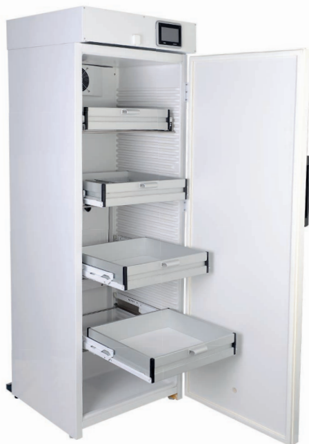
K380 BUE Réfrigérateur à médicaments